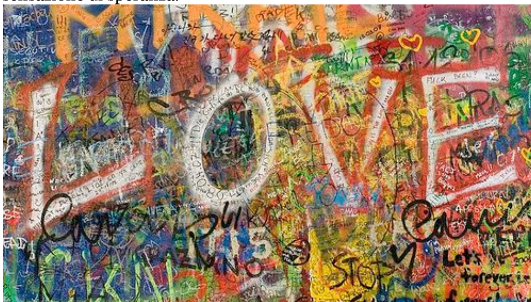
Il muro di John Lennon a Praga

1) è caduto il Muro di Berlino (il che ha portato a un ampio cambiamento del paesaggio politico, economico e culturale); 2) il Brasile è passato dalla dittatura alla democrazia; 3) Nelson Mandela è uscito di prigione e il sistema dell'Apartheid in Sud Africa è stato dissolto, il che ha portato alle prime elezioni democratiche; e 4) il regime Comunista dell'URSS si è disintegrato. Molte persone hanno vissuto in quel periodo esperienze trasformative nella loro vita, e si sono sentite pervase da una nuova sensazione di speranza.